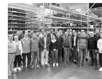
ESPRIT DE FAMILLE