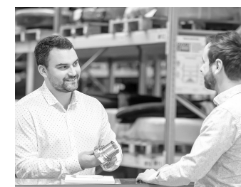
PASSION DU CLIENT