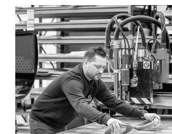
CONFIANCE & AUTONOMIE